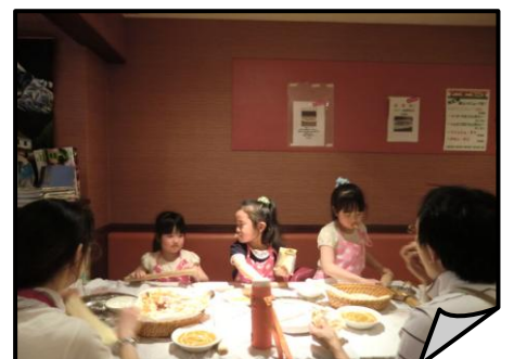
みんなで食べると美味しいね