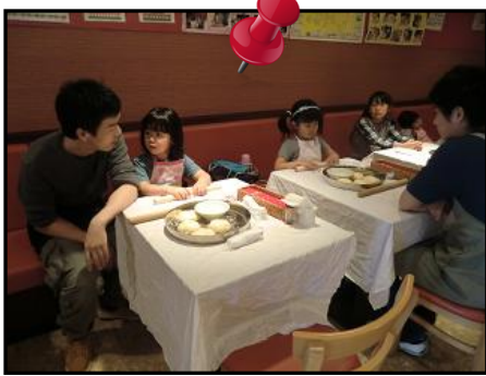
みんなでナンの生地をこねてこねて

小さいお子さんと親御さんに大人気の、インドカレー店でのナン作り体験講座。今回は5回目、6回目の開催でした。今回もたくさんのご応募をいただきまして、ありがとうございました。プレーンナンの他に、お持ちいただいた好きな具材を使って、自分だけのナンを作ってもらいました。