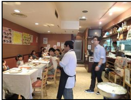
コックさんが実演をしてくれます