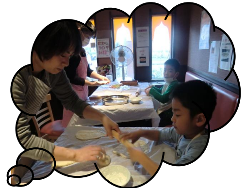
お母さんと協力して作ろう！