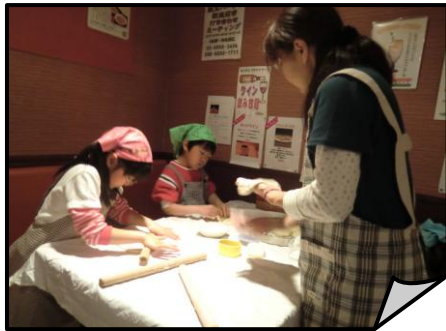
うまく伸ばせるかな？