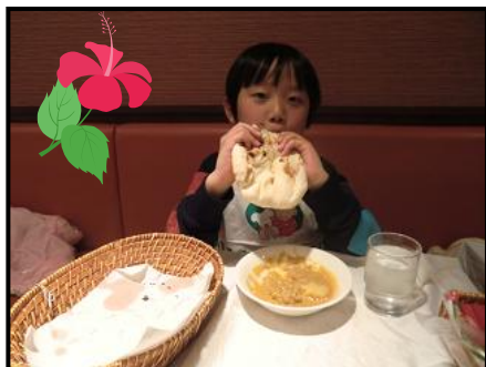
焼きあがった出来たてのナンはホカホカ！ カレーにつけて食べてみよう