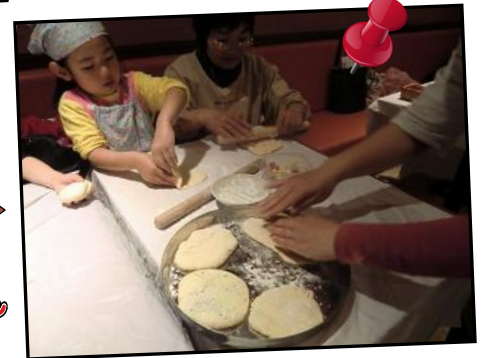
何をいれたのかな？どんな形にしようかな