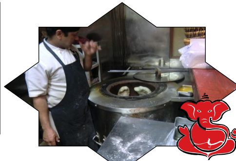
大きな専用の窯で焼いてもらいます