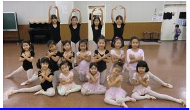
取材へのご協力ありがとうございました。

【先生へメッセージをお願いします】 ◆いつも元気すぎる子どもたちを優しく指導していただきありがとうございます。これからも宜しく願い致します◆いつも娘たちがお世話になっています！楽しく体を動かす事を目的で入会しましたが、1つ1つ出来る事が増えてくる度に『目標を持って少しずつでも努力すれば何事も上達する』ということを学んだようです。これからも宜しく願い致します◆2人の娘がいつもお世話になっています。すぐ遊んでしまう幼稚園児をうまく指導していただきありがとうございます。ほめてもらった日はとても喜んで帰宅しています。上のクラスの子たちは先生が会った時に様子を伝えてくれるので声掛けができます。その一言が親にも子にもありがたいです。いつもありがとうございます。