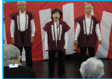
★女性も大迫力の甚句をご披露。