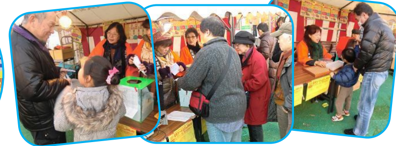
みなさま何が当たったのでしょうか？とっても楽しい雰囲気での抽選会でした。