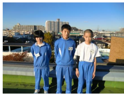
★センター施設見学時の屋上での撮影。

★体育館のギャラリー清掃のお手伝い。綺麗にしていたいただきありがとうございます。