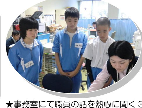
★事務室にて職員の話をお熱心に聞く3名。

（6ページからの続き） これには、大助かりでした。お願いしたことは素直に聞いてくれたおかげ、チームワークの勝利です！（設営中の写真は9ページに掲載） そのほか、3名には体育館のギャラリー清掃もおこなってもらいました。