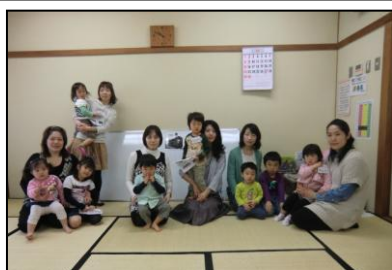
取材へのご協力ありがとうございました。