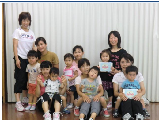
取材へのご協力ありがとうございました。

日時: 9月13日・27日、10月11日 各木曜日 料金: 30円(保険料) 童謡やなじみの深い歌に合わせて親子で体を動かします。母親のシェイプアップとママ同士の交流の場にもなります。