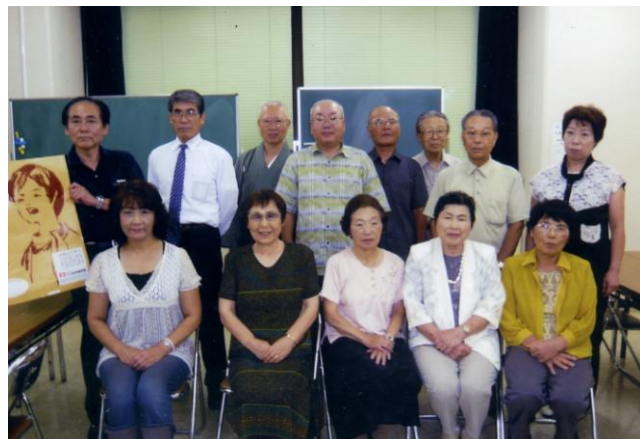
取材へのご協力ありがとうございました。

◆ご指導ありがとうございます。10年後には自分が納得する吟が出来ればと思います。◆入会してまだ浅いですが、親切に何回も繰り返し教えてくださり、ありがたいと思っています。◆なごやかに指導して下さい、楽しく学ぶことができます。いつまでも健康でご指導お願い致します。◆とても親切で分かりやすく教えていただき助かっております。いつも感謝しております。