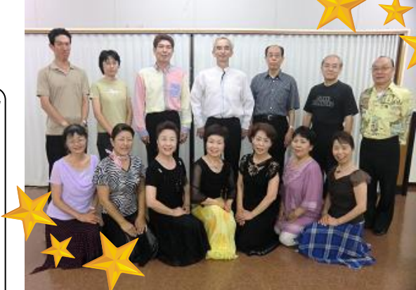
取材へのご協力ありがとうございました。

先生へメッセージをお願い致します！ ◆いつも甘口と辛口のご指導ありがとうございます。とても楽しいです。◆丁寧に解りやすく指導し、その中に笑いがあり本当に楽しくお稽古出来ます。◆ワクワクする振付に魅入られています。先生に教えていただきたくて、続けています。ありがとうございます。