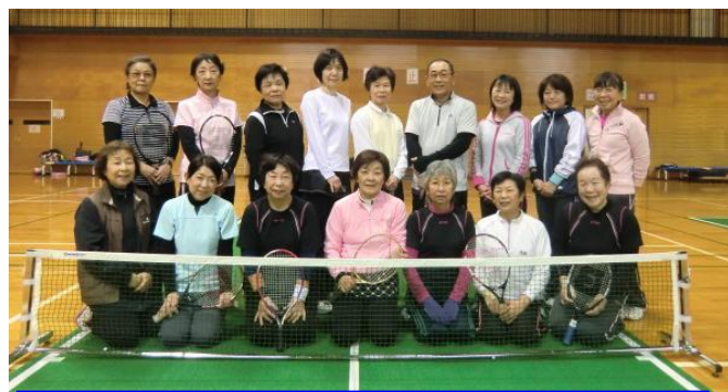
取材へのご協力ありがとうございました。

◆いつまでも元気で若さを保って美しくいてください。◆ご指導いただき感謝しております。◆いつもご指導ありがとうございます。BTクラブをいつまでもご指導お願い致します。◆楽しく教えていただき、ありがとうございます。◆いつもお世話になっております。これからも、よろしくお願い致します。