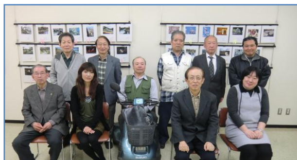
取材へのご協力ありがとうございました。

◆いつもありがとうございます。とても勉強になります。◆色々なことを教えていただき、ありがとうございます。◆いつもご指導ありがとうございます。アドバイスをいつも思い出しながら夫婦で楽しんでいます。これからも宜しくお願いします。