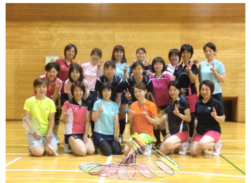
取材へのご協力ありがとうございました。

◆ひとりひとりのレベルや、性格にあわせ、きめ細やかにほめてくださったり、しかってくださったりしながら、ご指導して下さったので今日まで長く続けてこれたのだと思います。◆私たちのレベルアップのために練習メニューを考えたり、とても感謝しています。バドミントンを愛する姿勢を見習いたいです。◆いつも厳しく、優しく教えて頂き、ありがとうございます。コーチの明るい性格が大好きです。