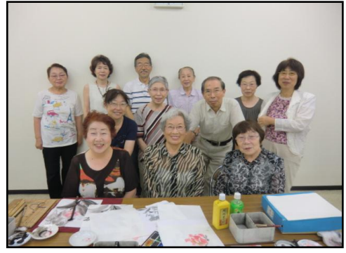
取材へのご協力ありがとうございました。

◆魔法の筆先に魅了されています。いつもご指導ありがとうございます。◆いつも優しく、穏やかに話をしてくださりありがとうございます。◆暑さ、寒さに関わらず皆平等に親切に指導してください。先生のお人柄が良いので続けられます。◆なかなか上達しませんが末永くよろしくお祈りします。◆分かりやすく説明して下さるのでいつの間にか描けるようになりました。◆筆の動き、手の動かし方など丁寧に教えてくださる。新人でも長い目で見てくださっているのでも嬉しいです。