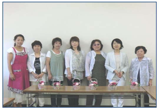
取材へのご協力ありがとうございました。

先生は明るく、優しい方なので、質問もしやすく、いつも楽しく参加させてもらっています。いつも素敵と言ってほめてくれます。それだけで満足。不器用だけど、よろしく願いいたします。なかなか毎回出席できませんが、いつも楽しく(時々難しく悩みますが)やらせていただいています。これからもよろしく願いいたします。