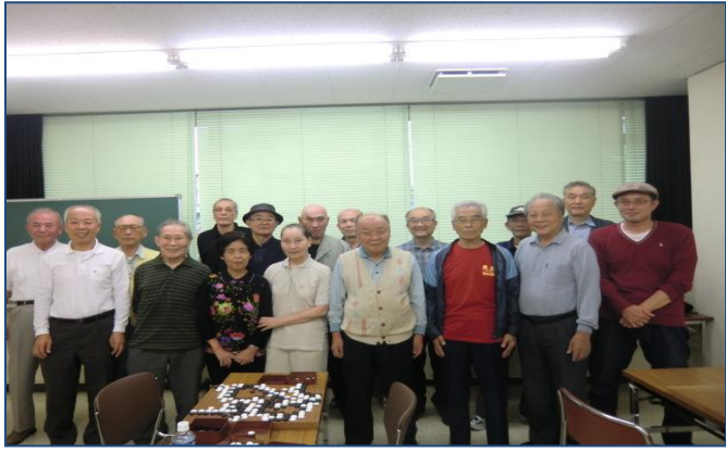
取材へのご協力ありがとうございました。

◆いつもご自分が打つ時間もない程、色々やってくれます。これからもよろしく願いいたします。◆会ができて20年位になると思いますが、よく続いていると感心します。会員相互のコミュニケーションがいいからか感じます。◆会場の確保、設営ご苦労様です。いつもありがとうございます。