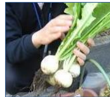
立派な野菜になりました！！