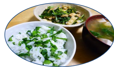
収穫した野菜は、葉っぱまで余すところなく、おいしくいただきました。