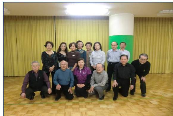
取材へのご協力ありがとうございました。

講師の方へメッセージをお願いします! ◆親切で冗談を交え、楽しいです。◆先生は元気で、指導力もあり、楽しい(時々ギャグもあり...)先生です。◆高齢ですが、今後ともよろしくお願ひします。