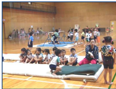
▶マット運動の練習

教室では、時にレベル別に分け、上手くできない子にも先生が最後まであきらめずに指導しています。子どもたちも懸命に付いて行きます。できないことを恥ずかしながら、苦手なものを克服しようとする前向きな姿勢を学びます。できた時のその達成感は子どもたちを大きく成長させてくれます。