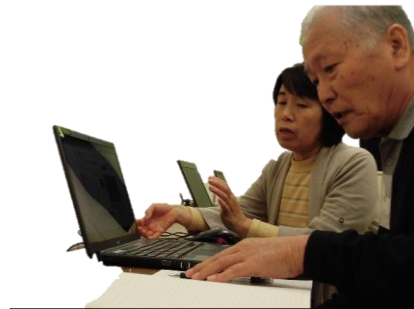
古賀さん（左）と参加者（右）