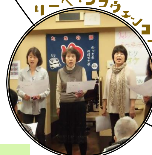
リーベ・フラウエンコールあだち

唄とダンスを披露し、ウクレレ演奏に合わせて登場した踊り子と観覧者が、一緒にフラダンスを踊る場面も見受けられました。南国の雰囲気たっぷりの音色が、過ぎ去った夏の余韻を偲ばせる素敵な発表会となりました。