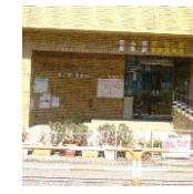
中央本町住区センター