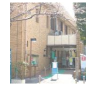
五反野コミュニティセンター