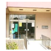
青井住区センター