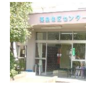
栗島住区センター