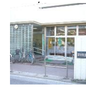
弘道住区センター