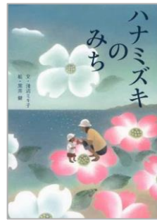
『ハナミズキのみち』 浅沼ミキ子/著 金の星社