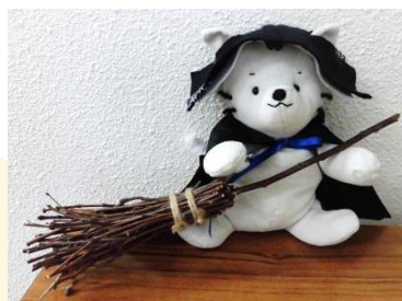
『新魔女図鑑』 角野栄子/著 ブロンズ新社

こんにちは。手芸担当丸山です。今回はハロウィンにちなんで、魔女のほうきを手作りしてみました！本当はまたがって空を飛べるくらいのは大きなのですが、今回は手軽に作れるミニサイズです。