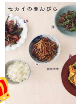
『セカイのきんぴら』 飯島 奈美 / 著 朝日新聞出版