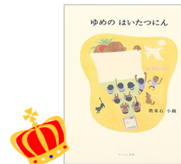
『ゆめのはいたつにん』 教来石小織 / 著 センジュ出版