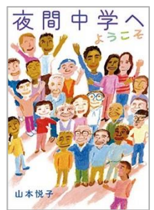
『夜間中学へようこそ』 山本 悦子/作 岩崎書店