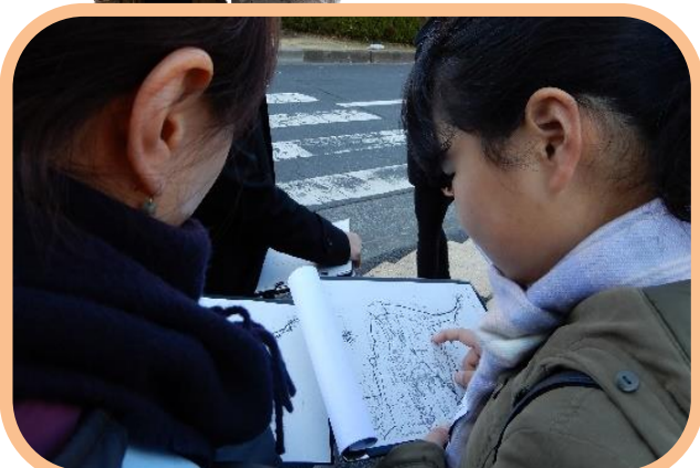
古地図を見ながら昔と今の違いを研究中！