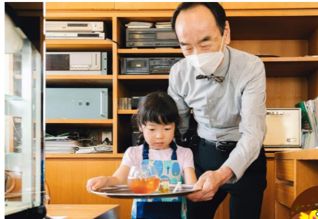
「カフェテラス絵瑠座でカフェ店員」