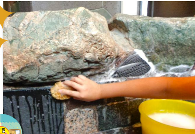
「若松湯で鏡を磨いてお風呂に入ろう」