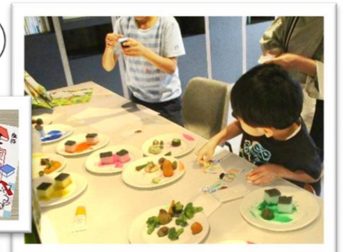
▲野菜スタンプを夢中で押す様子