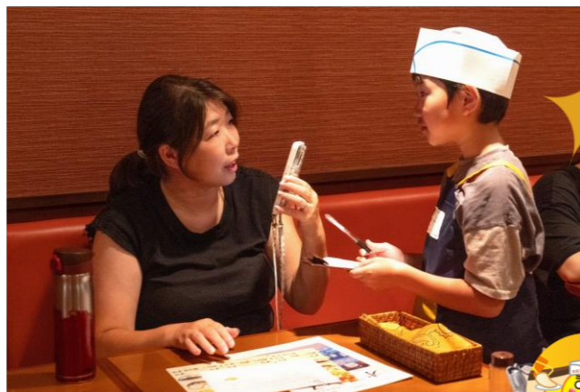
「インドカレー店 BINITA でナン作りお仕事体験」