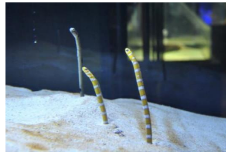
↑隠れ名人チンアナゴ!

〒121-0064 足立区保木間2丁目17-1 TEL: 03-3884-5577