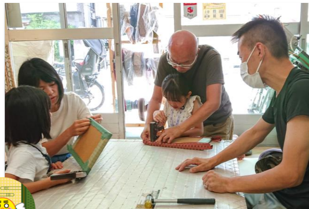
「野村畳店のミニミニ畳づくり」