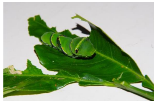
↑アゲハの幼虫は何を食べているのかな?

〒121-0064 足立区保木間2丁目17-1 TEL: 03-3884-5577