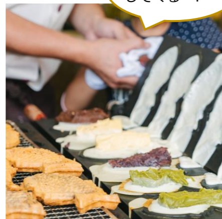
あま〜い匂がしてくる〜!